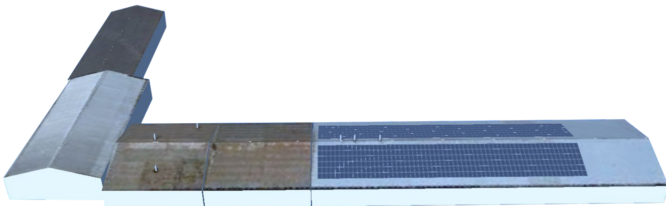
Zjednodušená vizualizace nově instalované FVE na budově „700/1- Sklad a výdej olejů“

Po realizaci řešeného projektu budou budovy v areálu společnosti ČEPRO, a.s. – Mstětice zásobovány kromě elektřiny z distribuční soustavy provozovatele ČEZ Distribuce, a.s. i elektřinou vyrobenou z nově instalované FVE 2. Vyrobená elektřina z nově budované fotovoltaické elektrárny FVE 2 bude dodávána do stávajících vnitroareálových rozvodů elektřiny společnosti ČEPRO, a.s. – Mstětice pomocí IO 01 do stávající rekonstruované přípojnice RIS 700/2 nacházející se na obvodové konstrukci budovy č. 700/2 „Sklad a výdej TB-NM olejů, LB (do sudu)“ tak, aby následně mohla sloužit výhradně pro spotřebu areálu. Systém fotovoltaické elektrárny je navržen tak, aby byly co nejvíce eliminovány přetoky do distribuční sítě a veškerá vyrobená elektřina byla spotřebovávána v areálu společnosti ČEPRO, a.s.